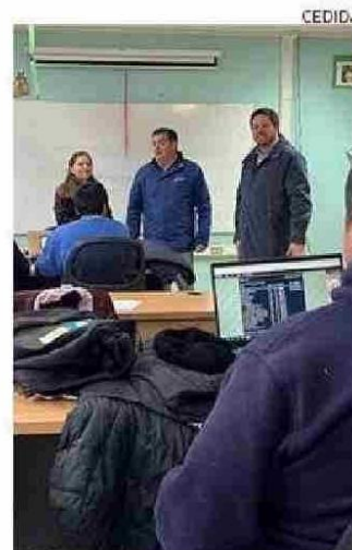
EL RECINTO PURRANQUINO NECESITA SER REFACCIONADO.