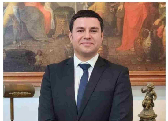
CARLOS BENEDETTI REYMAN, seremi de Educación de la región del Biobío.

El inicio de clases para los estudiantes está fijado para el miércoles 5 de marzo, mientras que el término de clases del primer semestre será el martes 17 de junio. Posteriormente, el miércoles 18 de junio se llevará a cabo el consejo de evaluación, antes de dar inicio al receso de invierno, programado desde el lunes 23 de junio hasta el viernes 4 de julio.