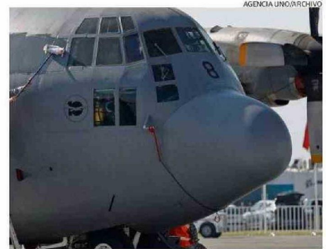
UN AVIÓN HÉRCULES C-130 COMO EL SINIESTRADO.