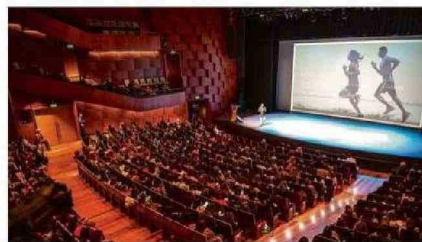
Vista general Mil Mujeres Más 2024.