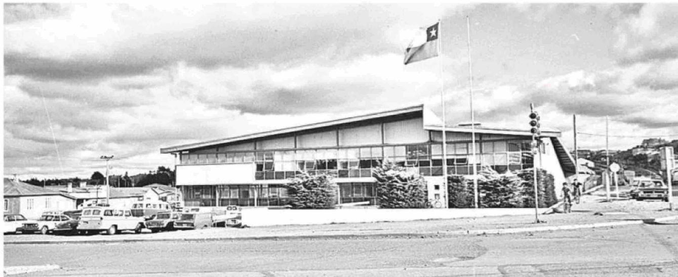
El 26 de abril de 1968 se inauguró oficialmente el nuevo y funcional edificio construido especialmente para la sede regional de la Universidad Técnica del Estado.