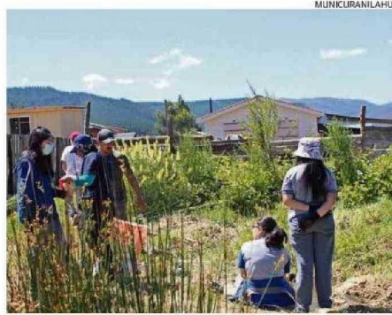
Humedales promueven servicios paisajísticos y de recreación.

pecies vegetales y animales que en general es difícil de encontrar en otros ecosistemas. Adicionalmente, canalizan la escorrentía y reducen el impacto de inundaciones sobre la infraestructura, facilitan la recarga hacia las aguas subterráneas y el intercambio de nutrientes, ayudan a filtrar contaminantes, mejorando la calidad de las aguas, y promueven servicios paisajísticos que conducen a