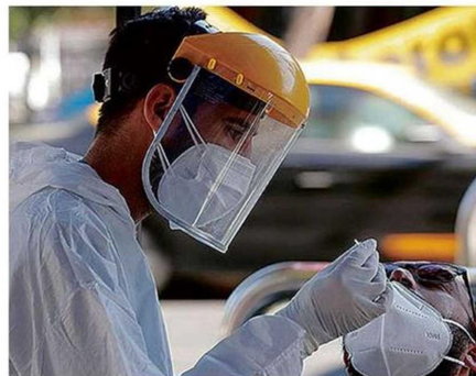
SEGÚN LOS EXPERTOS ES LA QUINTA OLA DE LA PANDEMIA.

jado gracias al proceso de vacunación, es importante que quienes no lo han hecho se refuercen con la cuarta dosis, sobre todo las personas mayores y enfermos crónicos”.