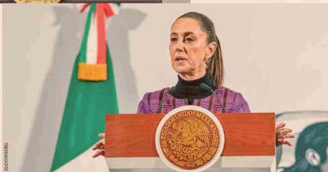
Claudia Sheinbaum, mandataria de México.