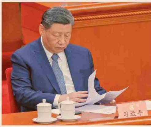
Xi Jinping, jefe de Estado de China.