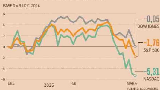
S&P 500, NASDAQ Y DOW JONES EN EL AÑO

Chile cayó durante la jornada de este martes, con un desempeño del peso chileno que destacó entre sus pares regionales.