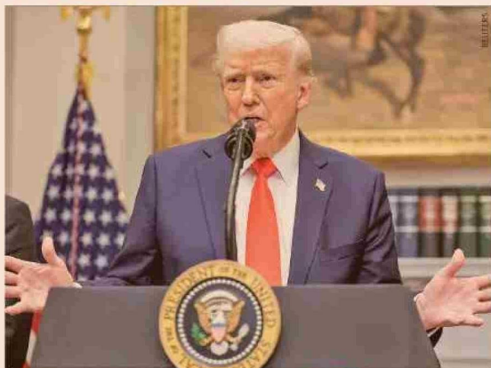
Donald Trump, Presidente de EEUU.