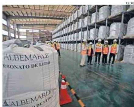
ACTUALMENTE LA CUOTA DE ALBEMARLE ES DE 262.132 TONELADAS LME.

acordaron una nueva cláusula que establece una opción que permitiría a la empresa ampliar su cuota de producción en 240.000 toneladas de litio metálico equivalente (LME), en la medida que pruebe y valide el uso de nuevas tecnologías ambientalmente más sostenibles (como por ejemplo la extracción directa de litio o DLE). Para ello, una vez que la compañía manifieste su intención de hacer uso de la opción, Corfo deberá llevar adelante un proceso de Consulta Indígena