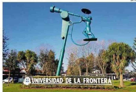
LA JUNTA DIRECTIVA CONFORMARÁ UN COMITÉ DE CRISIS QUE PERMITA INICIAR UN PROCESO ELECCIONARIO PARA UN NUEVO RECTOR O RECTORA.