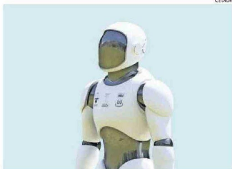
ASÍ LUCIRÁ EL ROBOT UNA VEZ TERMINADO. SE MOVERÁ CON RUEDAS.