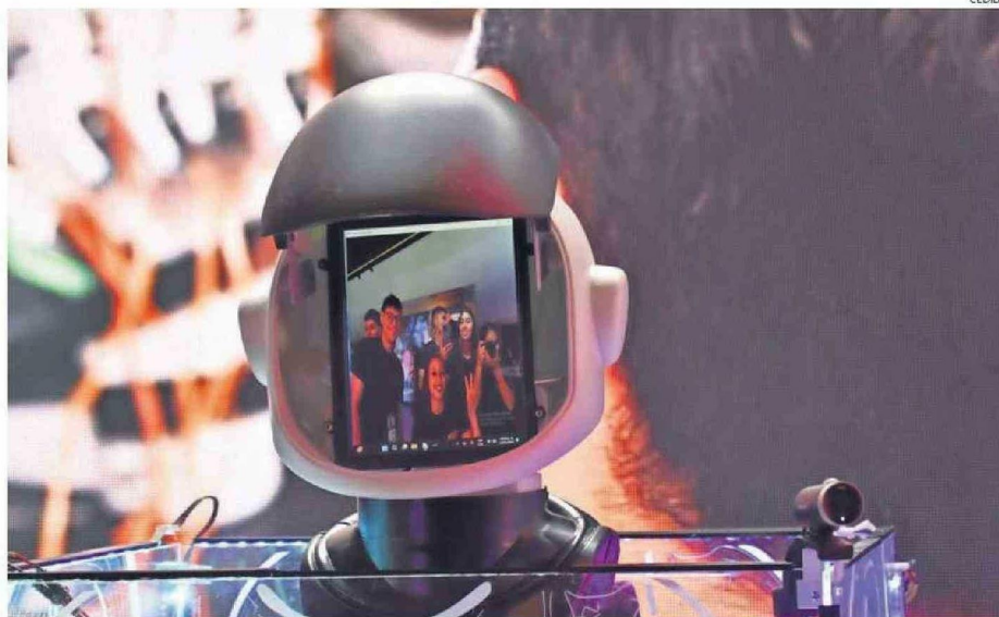
LA CABEZA DE STELARBOT YA ESTÁ LISTA Y SE EXHIBIÓ EN CONGRESO FUTURO 2025. EN EL CASCO SE VERÁ EL ROSTRO DEL USUARIO.