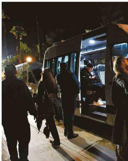
QUIENES ESTABAN EN LA QUINTA SE RETIRARON A OSCURAS Y CON ESCASA LOCOMOCIÓN.

Los organizadores agradecieron la flexibilidad de los artistas para estar disponibles en esta nueva fecha y aclararon que decidieron no omitir