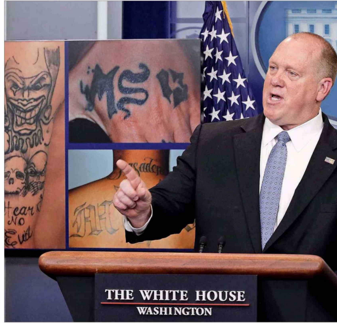
TOM HOMAN vuelve como director del ICE y estará a cargo de las deportaciones masivas de migrantes ilegales.