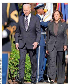
BIDEN Y HARRIS llegaron ayer hasta el Cementerio Nacional de Arlington.