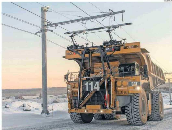
LA TECNOLOGÍA TROLLEY OPTIMIZA LAS OPERACIONES Y REDUCE EL IMPACTO AMBIENTAL DE LAS FLOTAS DE CAEX.

EFEECTO TRANSFORMADOR Desde Equans Chile, que pres-