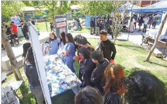
Alumnos y comunidad educativa del Liceo José Victorino Lastarria disfrutaron de la Primera Feria de Salud Mental.

Título: Primera Feria de Salud Mental organizó Liceo José Victorino Lastarria