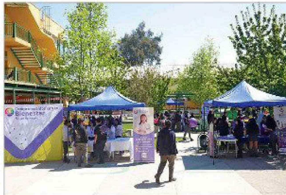
Los amplios jardines internos del Liceo José Victorino Lastarria sirvió para la instalación de los stands de la Primera Feria de Salud Mental.