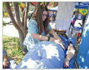
Un día lleno de actividades entretenidas para estudiantes y comunidad educativa del Liceo José Victorino Lastarria.