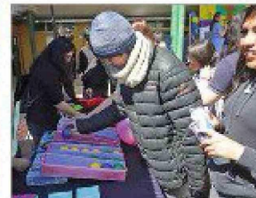
Actividades diólicas y recreativas disfrutaron los asistentes.