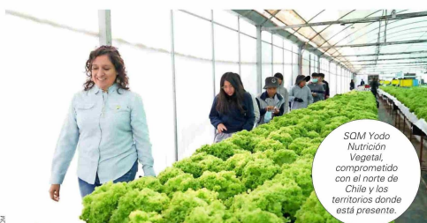
SQM Yodo Nutrición Vegetal, comprometido con el norte de Chile y los territorios donde está presente.