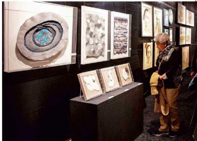
EXPOARTE SANTO DOMINGO SE LLEVARÁ A CABO EN EL COLEGIO HELEN LEE LASSEN.

“En la conmemoración de los 128 años de amistad y relaciones diplomáticas entre Japón y Chile, de los