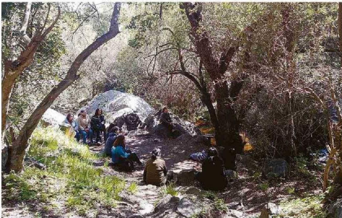
CAJÓN GRANDE EN OLMUÉ

Aunque sin acceso a la cumbre. También operarán el Santuario de la Naturaleza Laguna El Peral y el Parque Nacional Archipiélago de Juan Fernández. La Reserva Nacional Lago Peñuelas se mantendrá cerrada, al menos, hasta el mes de octubre.