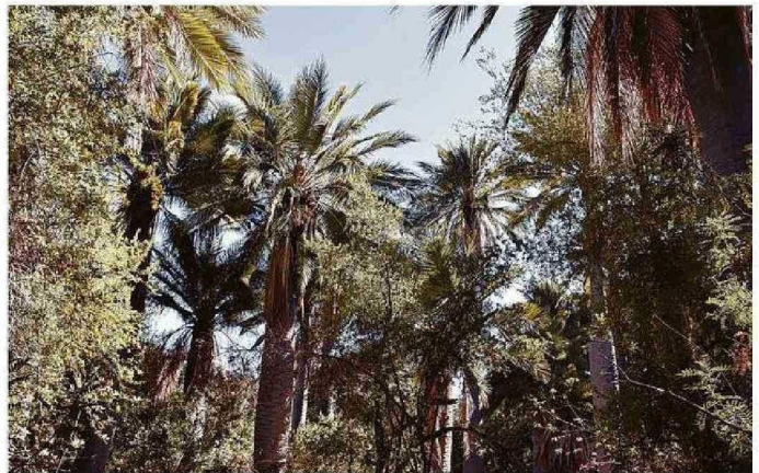
PALMAS DE OCOA EN HIJUELAS.