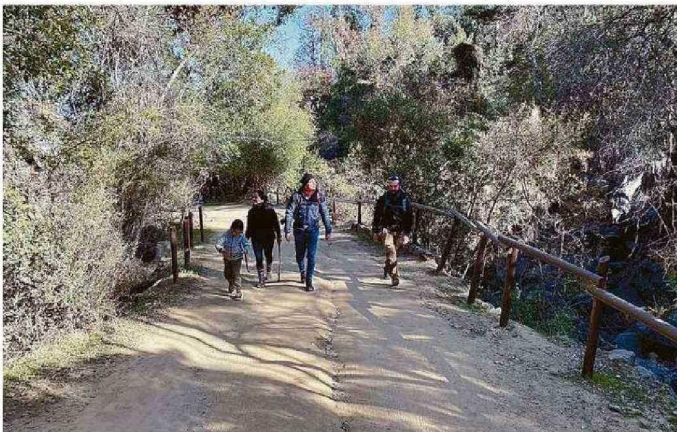
GRANIZO TAMBIÉN EN OLMUÉ. SENDERO EL ANDINISTA Y ACCESO A LA CUMBRE CERRADOS.