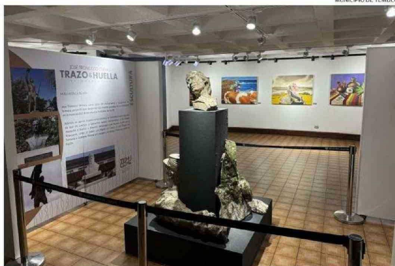
EN GALERÍA DE ARTE DE PLAZA ANÍBAL PINTO ESTÁ LA EXPOSICIÓN “TRAZO Y HUELLA-RETROSPECTIVA”.

La muestra que se presenta en la Galería de Arte de la Plaza Aníbal Pinto se compone de