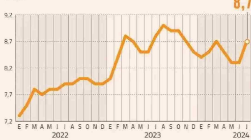
FUERZA DE TRABAJO VERSUS OCUPADOS % VAR. 12 MESES