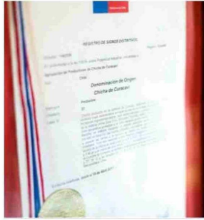
Por: José Ignacio Aguirre Recopilado por Juan Pablo Morales Farfán