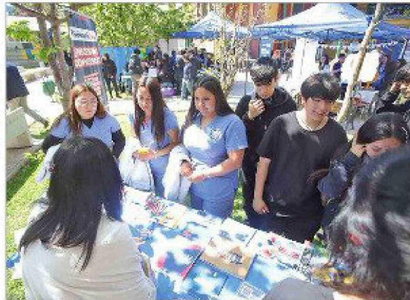
Una gran experiencia para alumnos y docentes en el Día Mundial de la Prevención del Suicidio en el liceo Lastarria de Rancagua.

La actividad estuvo enmarcada en el Día Mundial de la Prevención del Suicidio, que se conmemoró el pasado mes de septiembre.