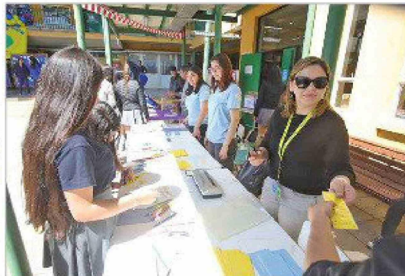
El conglomerado estudiantil recibió información sobre actividades que les ayuden sobre las técnicas de regularización emocional.