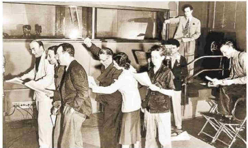
La tragedia del dirigible Hindenburg inspiró al actor que interpretó al periodista para componer su personaje.