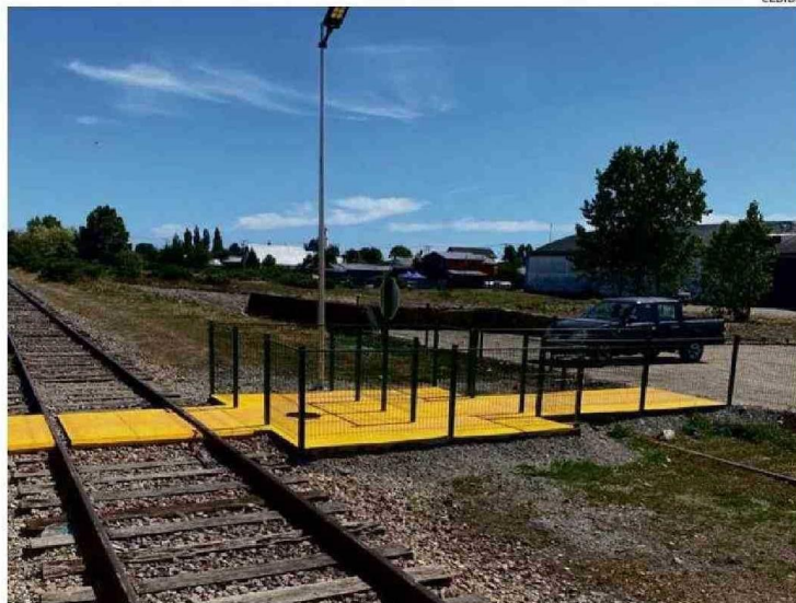
EFE SE COMPROMETIÓ CON LA CONSTRUCCIÓN DE LOS LLAMADOS LABERINTOS DE SEGURIDAD EN CADA CRUCE.

del jueves pasado se verificó el incidente en el cruce La Vara, grabado con un celular por una vecina del sector.