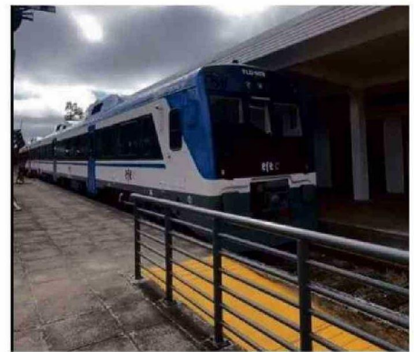
EN MARCHA BLANCA SE ENCUENTRA EL TREN EN LA ZONA.