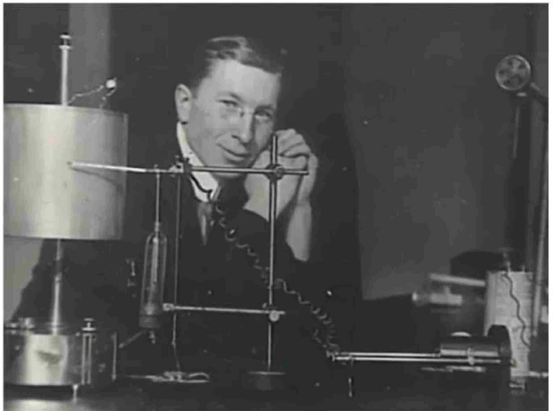
Antes de convertirse en médico, Banting sintió la vocación de ser sacerdote: al terminar el secundario empezó a estudiar Teología en la Universidad de Toronto.