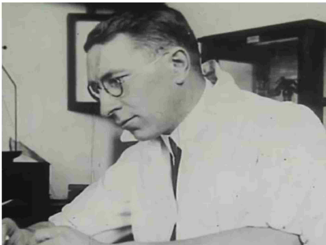
En 1923, cuando solo tenía 32 años, Frederick Grant Banting recibió el Premio Nobel de fisiología y Medicina: es el científico más joven en recibir el galardón.