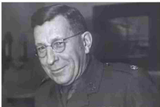
Luego de lograr aislar la insulina, se comprometió con la investigación aeronáutica y creó un traje espacial capaz de resistir la gravedad.

Así estaban las cosas en 1920 cuando Banting se topó con un artículo científico sobre Fisiología Pancreática donde se describía el caso de un perro de laboratorio al que un cálculo pancreático estaba obstruyendo los conductos de secreción de enzimas digestivas, y en consecuencia mataban el tejido acinar sin afectar los islotes de Langerhans. Banting empezó a vislumbrar una idea brillante: ligar el conducto pancreático de los perros y esperar entonces que el tejido acinar degenerara liberando los islotes. Así, pensó, se podía aislar la insulina.