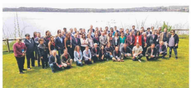
© Panorámica general del Encuentro de Diarios Regionales 2024 en Puerto Varas.