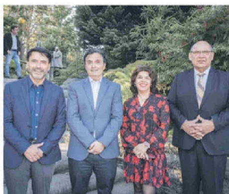
© Luis Becerra , Corre Electo; Gonzalo Toledo , director de Relaciones con la Educación Media de Inacap; Tabita Moreno , directora de Diario Concepción, y Fernando Reyes , gerente general de El Tipógrafo.