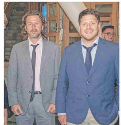
© Antonio Perocarpi , director de revista Tell Magazine, y Franco Perocarpi .