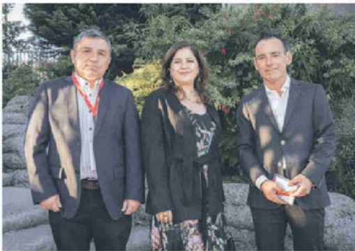
© Oswaldo Soto , director de Grupo Diario Sur; Rosa Villalobos , de Grupo Diario Sur; y Mauricio Rivas , director del diario Austral de Temuco.

Título: Libertad de prensa: Cuidar al periodismo para cuidar la democracia