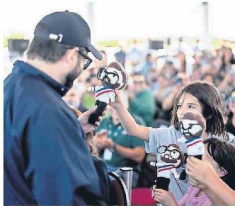
BORIC COMPARTIÓ CON NIÑOS EN SANTA BÁRBARA