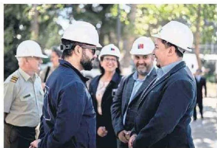
ES SU SEGUNDO DÍA DE GIRA EN LA REGIÓN DEL BIOBÍO.

vinculados al tráfico de madera”, indicó Boric, puntualizando que “los detenidos por robo de madera subieron un 10% en 2024 si los comparamos con el 2023 y en 2023 habían tenido un aumento muy significativo. Los hechos de violencia rural en la región que tuvo su peak histórico en 2021, a fines de diciembre de 2024 habían disminuido un