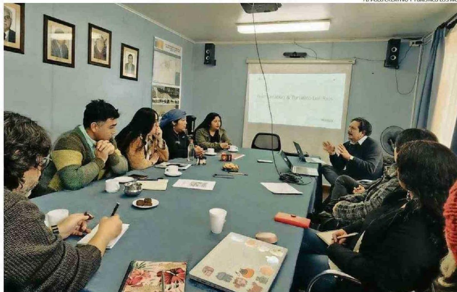
ENTRE MARZO Y JUNIO SE REALIZARON LAS MESSAS COMUNALES DE TRABAJO EN SIETE COMUNAS CONSIDERADAS DESTINOS TURÍSTICO.

“El proyecto puede tener un impacto muy grande, principalmente por su eje de comunicación y enlace entre la cultura y el turismo. Si bien cada polo cuenta con muchas iniciativas y avances, entrelazarlos y fortalecer el intercambio es lo que los va a fortalecer a largo plazo. Eso es algo que nuestra