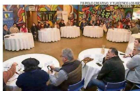
EL CONSEJO REGIONAL DE TURISMO SE REACTIVÓ EN MEDIO DEL PROYECTO.

oportunidades de negocios conjuntos como por ejemplo turismo creativo, turismo cultural, destinos creativos para poner en valor, que el polo creativo puede impulsar y desarrollar”.