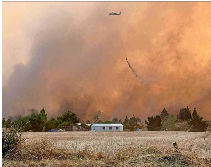
SINIESTROS FORESTALES. — Según el balance de ayer de la Conaf, en el país se registraban 31 incendios, de los cuales 17 focos estaban en La Araucanía. En la foto, el sector de El Prado, al sur de Traiguén.