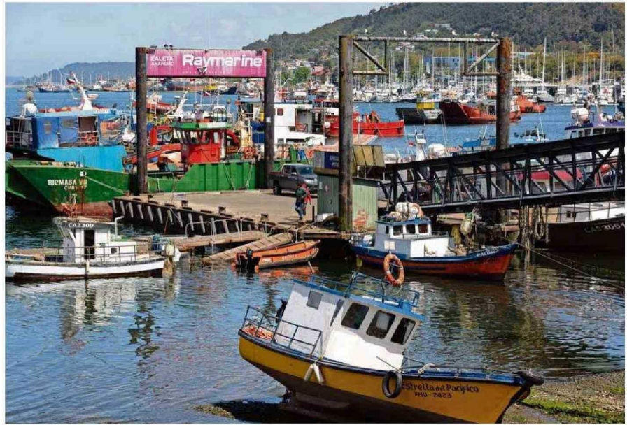
LA ACTIVIDAD DE LA INDUSTRIA ACUÍCOLA Y PESQUERA FUE RELEVANTE PARA ALCANZAR ESTE NIVEL DE DESARROLLO ECONÓMICO EN LOS LAGOS.

En segundo lugar están los servicios personales, como ac-