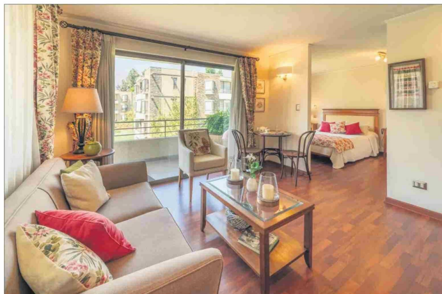
Los departamentos se arriendan con equipamiento completo.