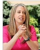
La embajadora de EE.UU. dejará Santiago por el cambio de mando en Washington.

ILÍCITOS LLEVADOS A CABO POR JÓVENES, SIN ADULTOS, VAN EN AUMENTO | C 8