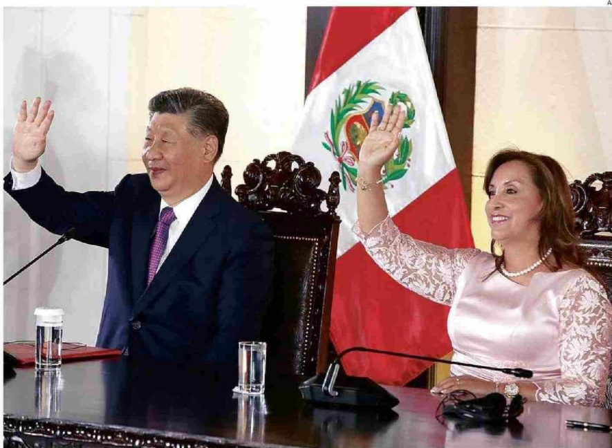
LA PRESIDENTA PERUANA, DINA BOLUARTE, Y SU HOMÓLOGO CHINO, XI JINPING, INAUGURARON DE MANERA REMOTA EL MEGAPUERTO.

Como “la joya de la corona de la Nueva ruta de la seda en Sudamérica” ha sido descrito el megapuerto por agencias y expertos internacionales, en alusión a los alcances geopolíticos de este nuevo eje del comercio en una región donde China -principal socio comercial de la mayoría de los países- ha hecho un millonario despliegue de inversiones y continúa potenciando los acuerdos económicos.