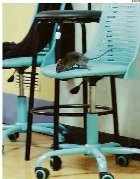
UN RATÓN HACIENDO NOTAR SU PRESENCIA SOBRE EL ASIENTO DE ALGÚN FUNCIONARIO.