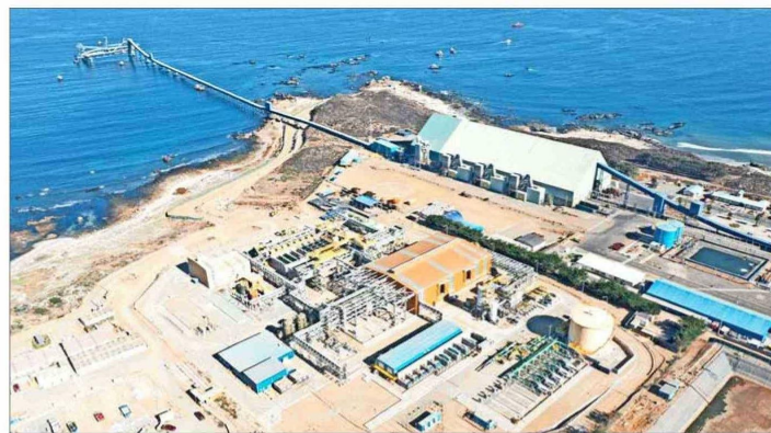
Según Cochilco, "el aumento del consumo energético vinculado al uso de agua desalada plantea desafíos importantes para las mineras".

“La adopción de agua de mar, tanto directa como desalada, ha sido fundamental en respuesta a la creciente escasez de agua continental. Sin embargo, este proceso presenta complejidades operativas y económicas debido a su alto consumo eléctrico, lo que incrementa los costos operacionales y ejerce presión sobre la matriz energética”, comenta la vicepresidenta ejecutiva (s) de