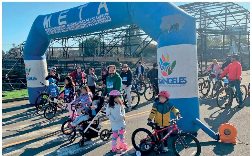
EN SU PRIMERA VERSIÓN la rodada de salud familiar convocó a decenas de participantes.

Según explicaron los profesionales, esta actividad consiste en realizar una ruta recreativa en cualquier vehículo con ruedas, sin motor, es decir, a tracción humana, como bicicletas, scooter, skate, sillas de ruedas, coches de bebé. “La idea es que este recorrido sea lo más inclusivo posible pues la actividad física es muy importante para todos y todas”, apuntaron.