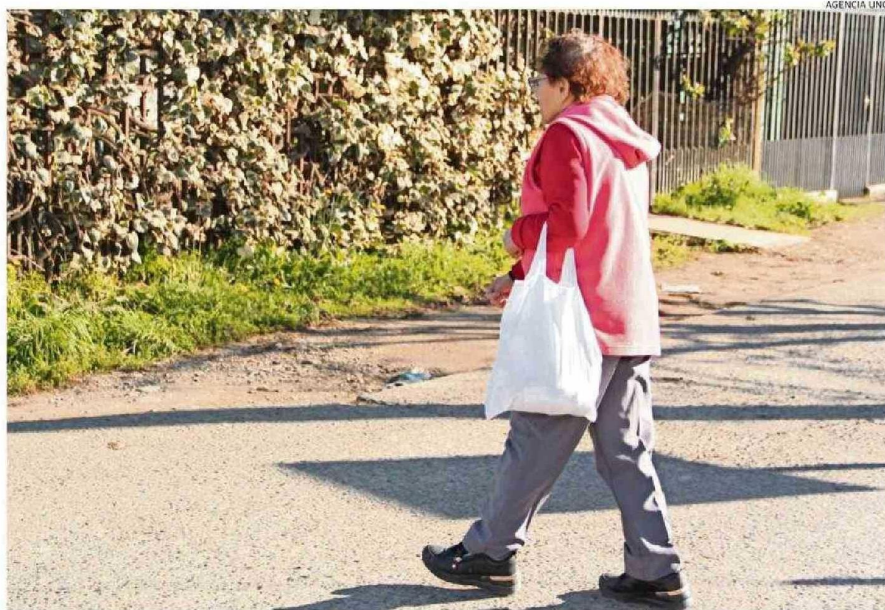
DE ACUERDO A PROYECCIONES DEL INE, EL 2035 EL 31,4% DE LA POBLACIÓN DE ÑUBLE TENDRÁ MÁS DE 60 AÑOS.

Y es que su relato es relevante al graficar una realidad país actual para una población importante no solo en el