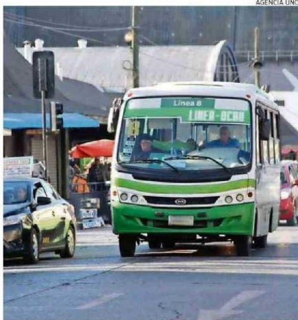
ADULTOS MAYORES DEMANDAN MAYOR CONECTIVIDAD EN TRANSPORTE.

los condominios de viviendas tuteladas, centros diurnos comunitarios, fondos de subsidios Eleam, Eleam Senama, y cuidados domiciliarios, de la mano con las unidades que cuidan", explicó Morales, con el objetivo de promover un envejecimiento digno, activo y saludable.