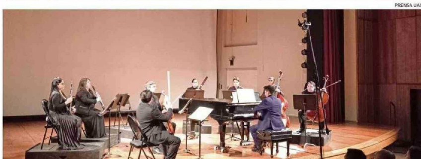
GENTILEZA MARCOS MATUS