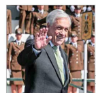
De concretarse la iniciativa, sería el exmandatario que obtendría más rápido el reconocimiento.

Museo Violeta Parra Cuestionan uso de recursos de la entidad: recibe $47 millones al mes y tiene 16 funcionarios, pese a estar inutilizable hace más de cinco años. | C 5