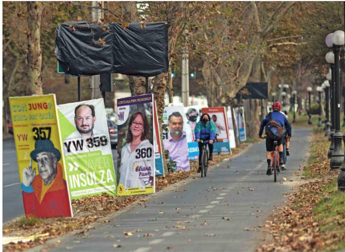
La pasada elección de alcaldes y concejales fue en abril de 2021, en plena pandemia de coronavirus..

Esta nueva etapa implica para los 18.738 candidatos acercarse a los más de quince millones de electores (15.450.377 exactamente), quienes vuelven a ser obligados a sufragar, por lo que se calcula desde el