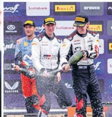
Kalle Rovanperä se impuso el pasado fin de semana en los caminos rurales de la zona.

Una década más tarde, el productor general saca cuentas alegres, destacando el nivel competitivo de las pistas rurales de la provincia de Biobío y la cordillera de Nahuelbuta. "Esta es una fecha que está en el borde de la definición del campeonato, y le da espectacularidad, permite que la gente de la Región –en la medida que le informe-