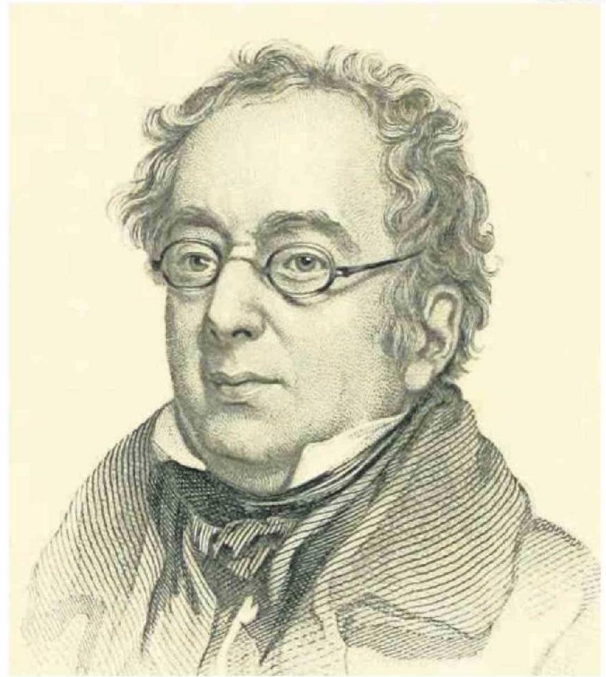
ISAAC DISRAELI PUBLICÓ "CURIOSIDADES DE LA LITERATURA" EN CUATRO TOMOS, ENTRE 1791 Y 1823.