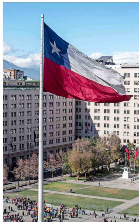
En América, Chile ocupa el quinto lugar del ranking , después de Canadá, Estados Unidos, Uruguay y Costa Rica.

bo un retroceso importante en regulación laboral. Sin embargo, dicha medición ocupa datos de 2021, por lo que no capta todavía las leyes laborales impulsadas por este gobierno. En las próximas mediciones esperamos ver un significativo retroceso en dicha materia por las alzas de sala-