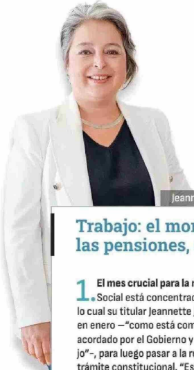
Jeannette Jara, ministra del Trabajo y Previsión Social.