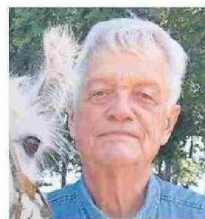
HEINRICH VON BAER.

men y el grupo folclórico El Rosal. Y entre sus logros personales está el ser campeona nacional de la cueca valseada 2020.