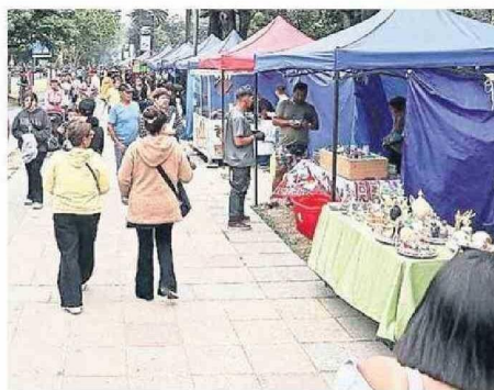
AMBULANTES FUERON UNA PREOCUPACIÓN EN LA FERIA DE 2024.