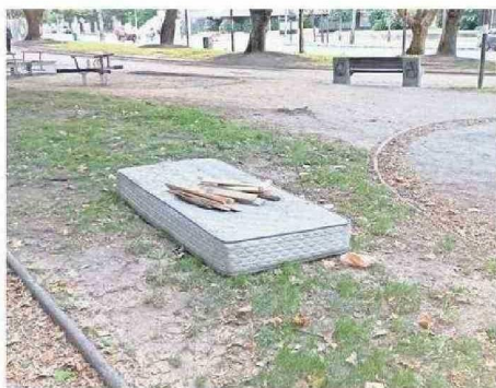
VECINOS ESPERAN MÁS CUIDADO CON LAS ÁREAS VERDES.

de un fin de semana, entonces se nos planteó una estrategia para abordar estos problemas y esperamos que se desarrolle de buena manera", indicó la dirigente, añadiendo que "lo complejo es la basura que se genera por la cantidad de gente que llega y los automóviles mal estacionados".