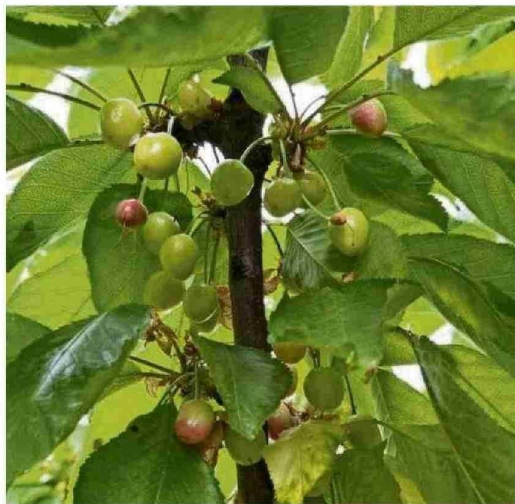
Foto 2. Pasma del cerezo causado probablemente a partir de una primavera fría.

La Niña podría afectar considerablemente la producción frutícola si trae consigo primaveras frescas y por consecuencia, una menor acumulación térmica. Las temperaturas frescas retrasarían el desarrollo de las plantas, disminuyendo la tasa de absorción de nutrientes, lo cual podría ser importante en huertos nuevos o productivos