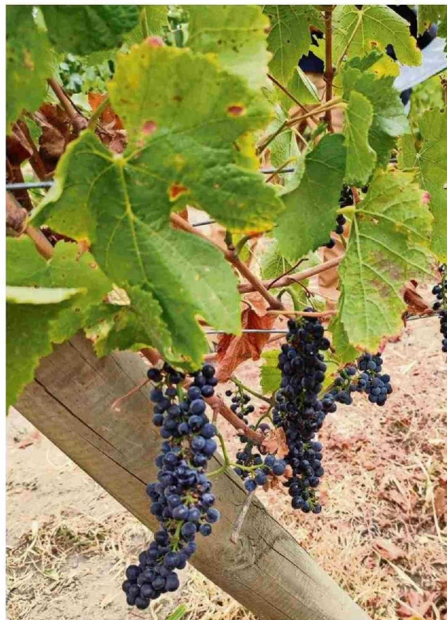
Foto 1. Problemas en la fecundación de racimos de uva a causa de una primavera fría en viñedos establecidos en La Araucanía.

Enología y están en proceso de publicación. Los cálculos de índices bioclimáticos fueron realizados durante el período de crecimiento y desarrollo de los frutales, lo que ocurre comúnmente desde septiembre a marzo. Los datos mostraron que la acumulación térmica media, cuantificada en unidades de calor, desde octubre a diciembre fue significativamente menor en temporadas La Niña (1.571 unidades de calor) comparado a años El Niño (1.635 unidades de calor) (valor p : 0.042).