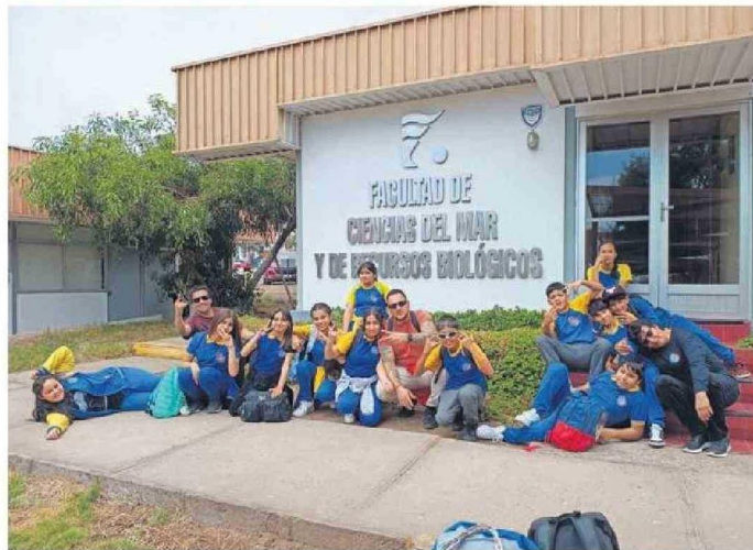
LOS ESTUDIANTES QUEDARON MUY FELICES CON ESTA EXPERIENCIA CIENTÍFICA.

Alumnos de sexto básico visitaron dependencias de la Universidad de Antofagasta.