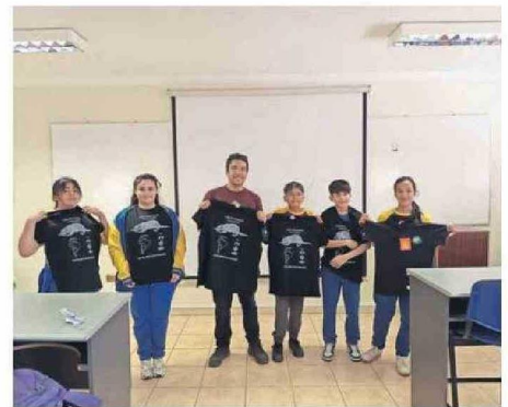
FUE UNA GRATA VISITA A LA UNIVERSIDAD DE ANTOFAGASTA.

"Estos talleres buscan fomentar la conciencia y