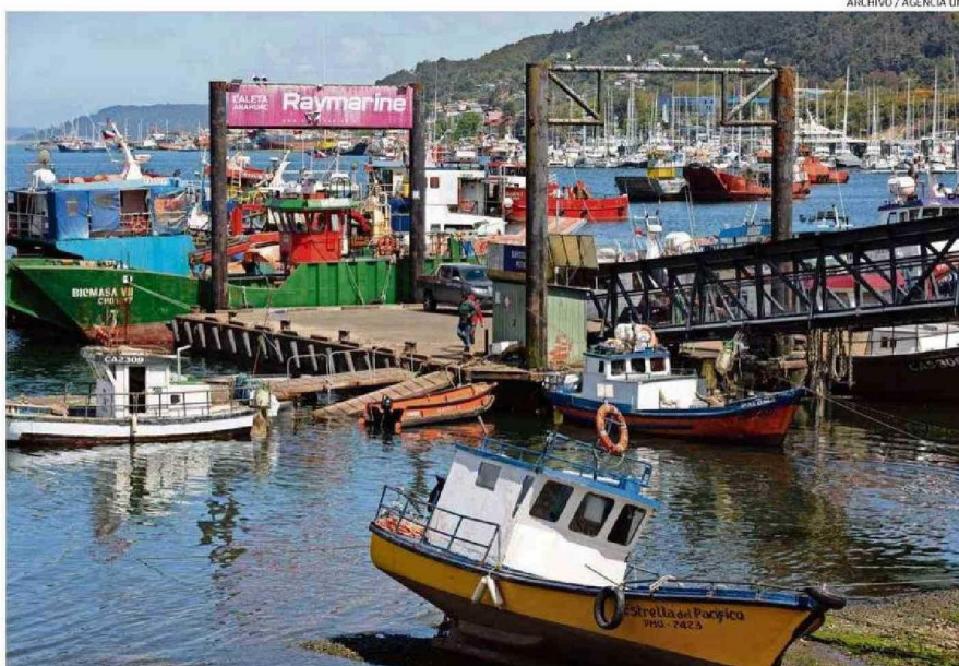
LA ACTIVIDAD DE LA INDUSTRIA ACUÍCOLA Y PESQUERA FUE RELEVANTE PARA ALCANZAR ESTE NIVEL DE DESARROLLO ECONÓMICO EN LOS LAGOS.

En segundo lugar están los servicios personales, como ac-