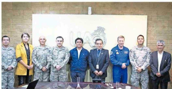
REPRESENTANTES DE LA UA, FACH Y EL GOBIERNO REGIONAL SE REUNIERON PARA COORDINAR EL PROYECTO.

Es por ello que durante estos días se realizó una reunión en la Universidad de Antofagasta (UA), casa de estudios que tendrá la misión de enfocarse en el desarrollo de capital humano y de los diseños de laboratorios para la construcción y operación de satélites de comunicaciones, gracias a la experiencia de sus centros de Investigación, Tecnología, Educación y Vinculación Astronómica (Citeva) o de Fisiología y Medicina de AL-